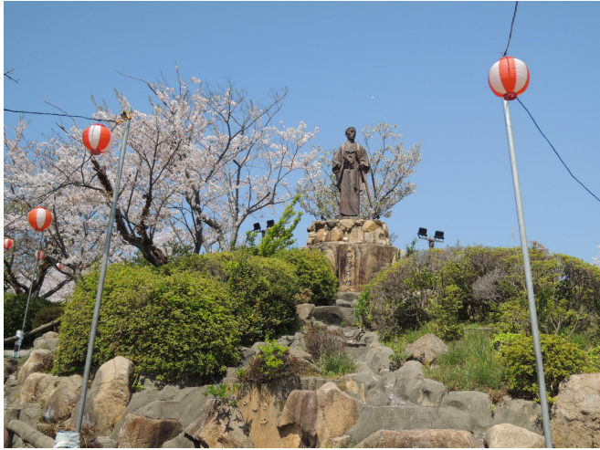
さくら満開の日和山公園