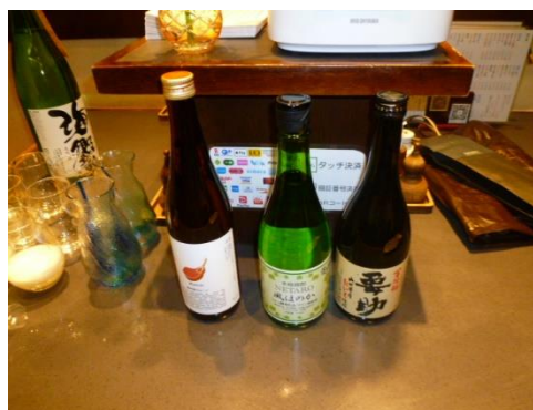
左：時田・守永 岡林・金川からの 差し入れ