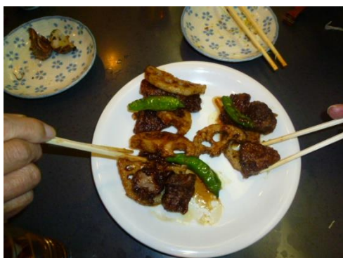
右：大場からの 差し入れ