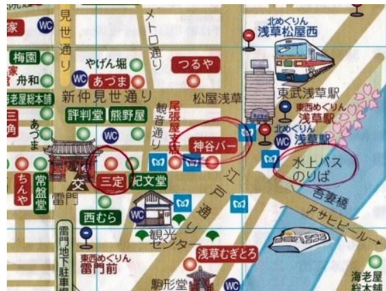
水上バスのりば写真(上左)と見取図(上右)

15:40 頃に「浜離宮恩賜公園」に到着します。写真下左は船着場、下右は「将軍お上り場」です。ここから将軍が舟から陸に上がりました。ここは将軍の鷹狩場でした。