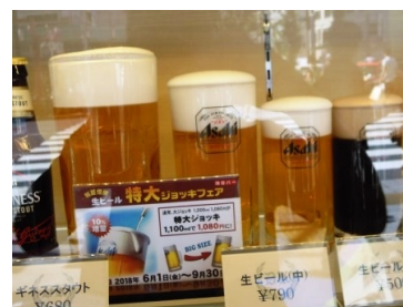
真ん中が中ジョッキ