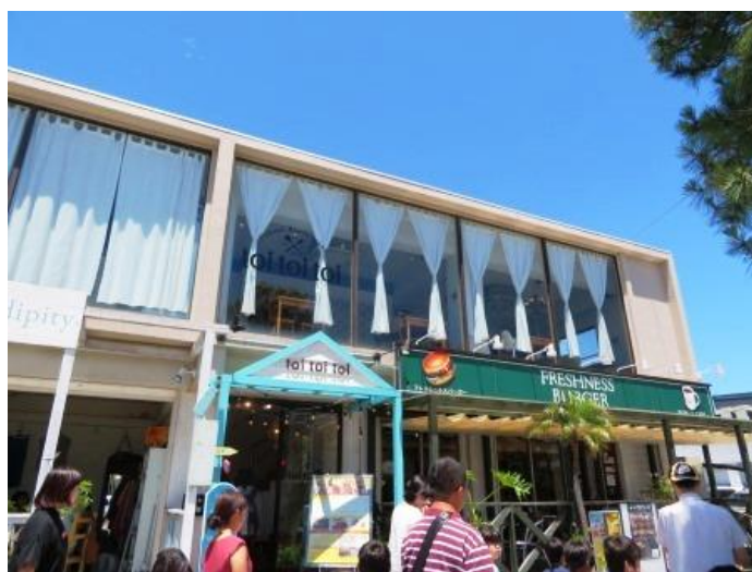
鎌倉イタリアン toi toi toi