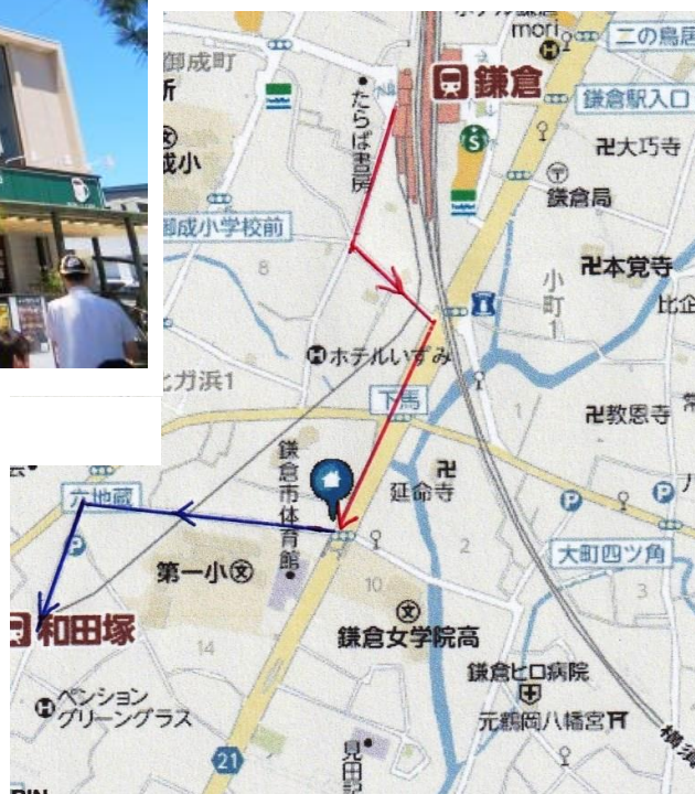
会食場までのルートと会食後の和田塚駅までのルート