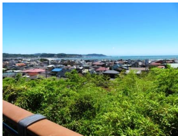
見晴台からの風景