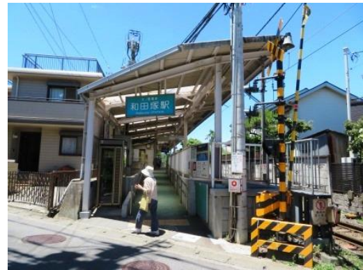
江ノ島電鉄「和田塚駅」

14:25 発に乗り、4分くらいで「長谷駅」に 着きます。ただし、満員で全員が乗れない場合、 乗り遅れた方は14:37 発に乗って下さい。運賃 は190円です。